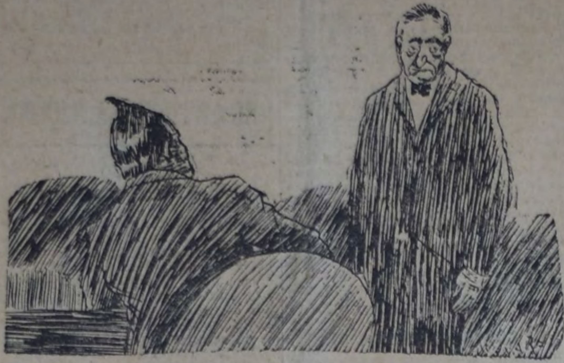
ELPIDIO — Por servirlo, mi "dotor", van a enjuiciarme. HIPOLITO — Lo sé. Pero ahora que la montaña se te viene encima, no hagas lo que Pedro que negó a su divino maestro...

cúmpleme el alto honor, illustre señor, de presentarlos, en nombre del radicalismo de la capital federal, el homenaje de todo su respeto.