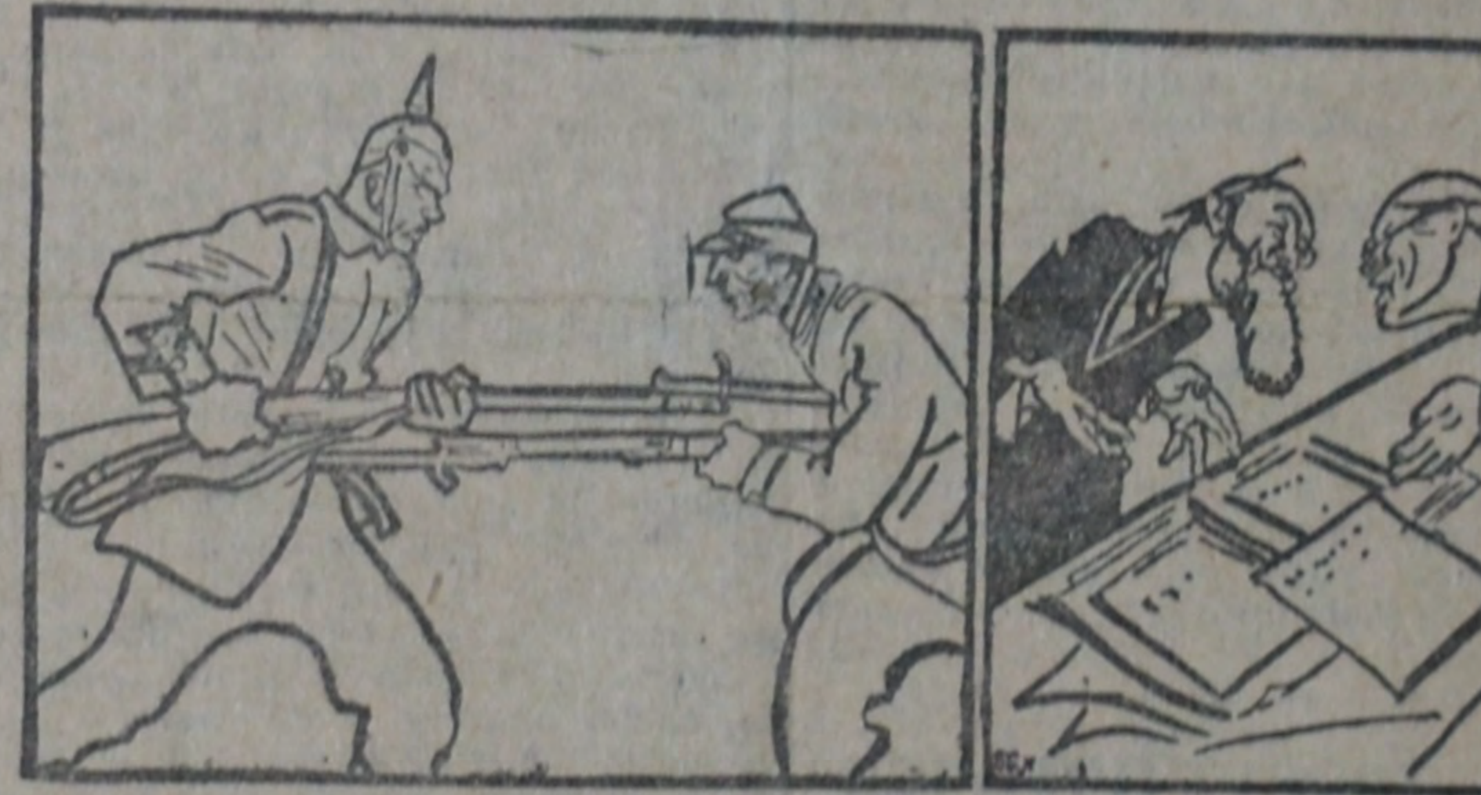
ALEMANIA Y FRANCIA 1914: Sangre y hierro. 1924: Carbón y hierro.